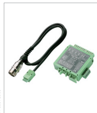
Ручной управляющий модуль (ННТ): Для упрощения юстировки